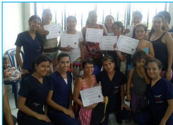
Programa: "Madres líderes para pautas de crianza"

VII semestre, con el curso cuidado de la salud a colectivos II, logró desarrollar COVECOM (4), con participación de la comunidad se establecieron y definieron 4 programas con los que en adelante se orientara la autogestión para mejora de los DSS, se delimitaron las problemáticas, se construyeron las acciones, y se iniciaron intervenciones de APS por grupos vulnerables así: