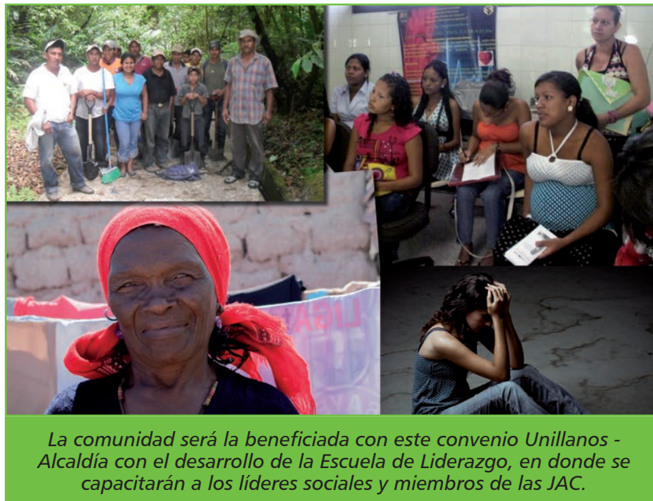
La comunidad será la beneficiada con este convenio Unillanos - Alcaldía con el desarrollo de la Escuela de Liderazgo, en donde se capacitarán a los líderes sociales y miembros de las JAC.

A través de este convenio, la Unillanos hace parte del Grupo Focal que estructurará y desarrollará la ESCUELA DE LIDERAZGO del municipio, que capacitará a los líderes sociales y miembros de las JAC y Organizaciones No Gubernamentales