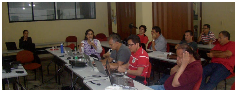
La foto muestra la primera sesión del diplomado, videoconferencia realizada en la sede Emporio de la Universidad de los Llanos.

El diplomado dirigido por el Ministerio fue propuesto para