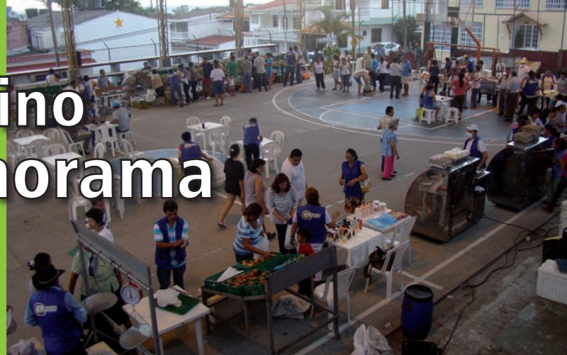
Panorámica del primer mercado campesino en el polideportivo del barrio Panorama, el 25 de enero de 2014.